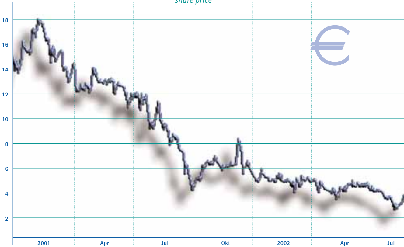
Kursentwicklung share price