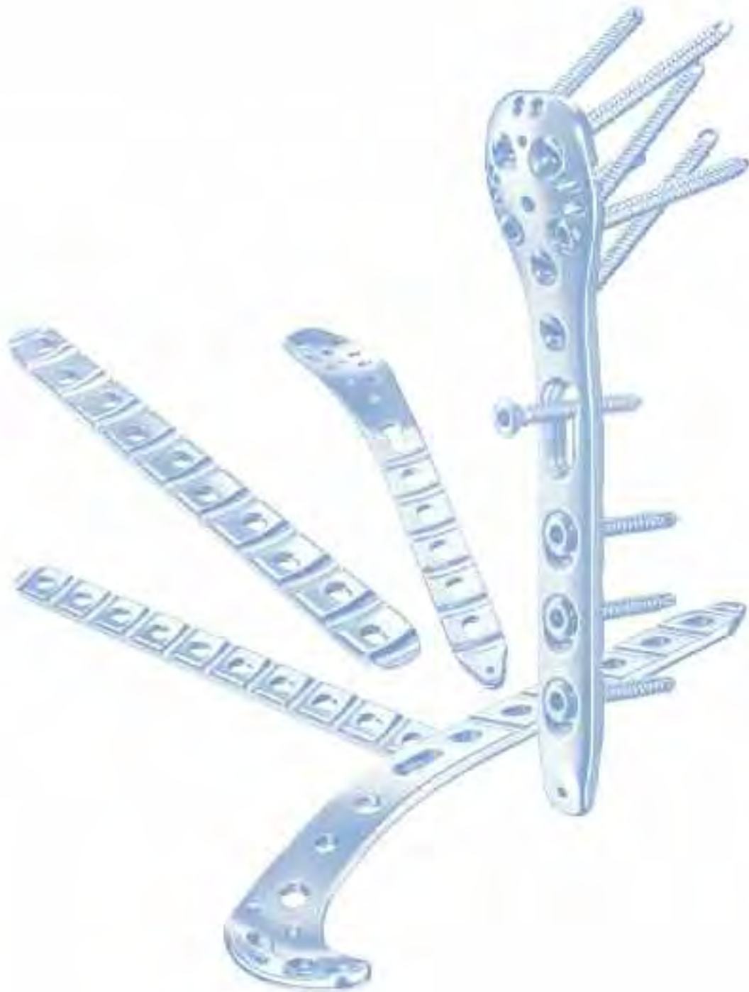
Anatomisches Plattensystem Anatomical Plating System