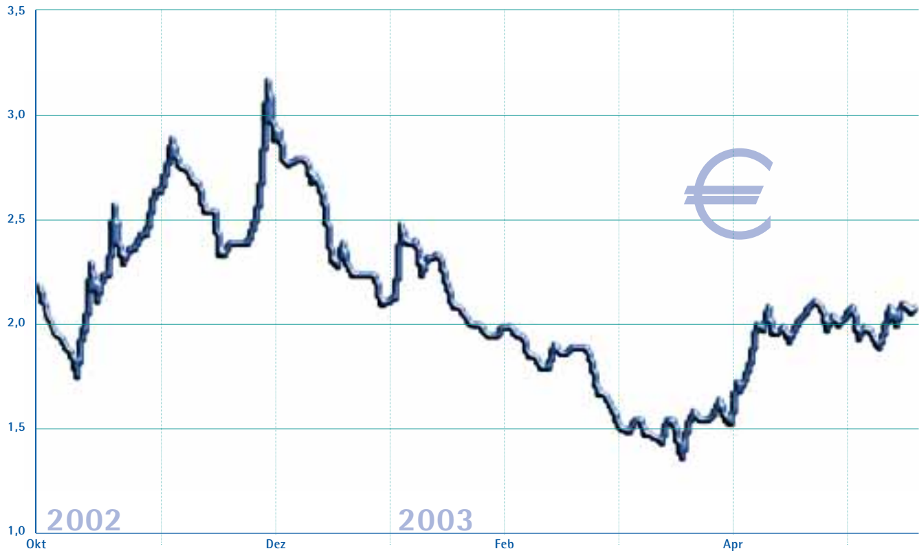
Kursentwicklung Price development of the aap share